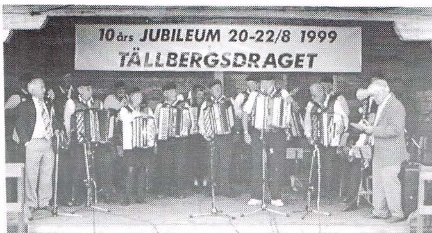
Vinnarna i Tällberg, 25-åriga Roslagsbälgarna.