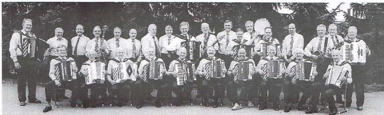
25 årsjubilerande Smedbälgarna. Arkivbild