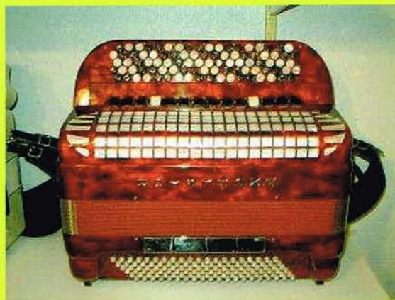
Modell Excelsior 922 Casotto