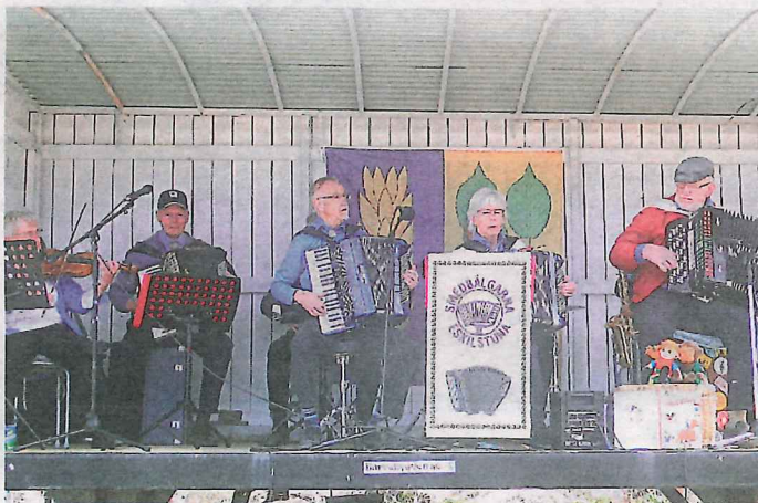
Smedbälgarna från Eskilstuna.