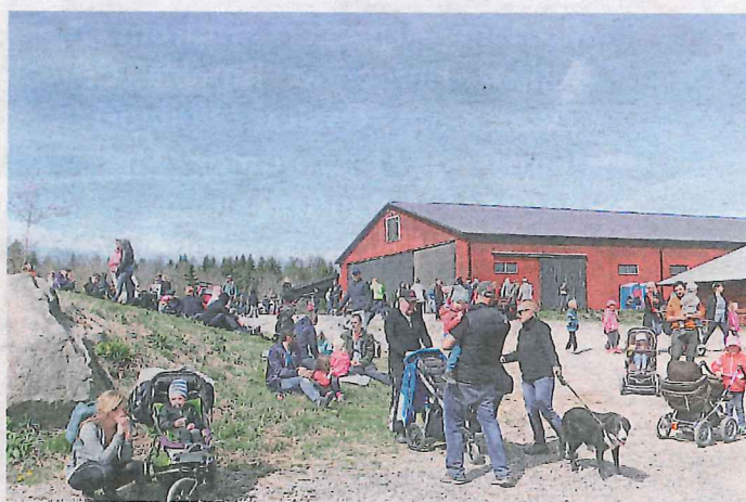
Betessläpp med musik lockade besökare till Lindholms Gård i Barva.

MITT SÖRMLAND är läsarnas eget forum för små och nära nyheter. På sormlandsbygden.se/mittsormland kan du själv skicka in nyheter och bilder från ditt område. En gång i månaden publicerar vi ett axplock här i tidningen.